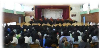
12月17日(水)音楽鑑賞教室