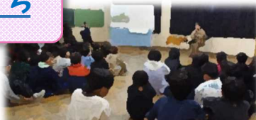
12月10日(水)3年民話語り部体験