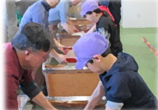
23日(金)4年社会科見学(紙漉き体験)