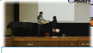
20日(火)給食感謝の会