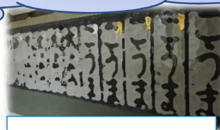
15日(木)校内書き初め展