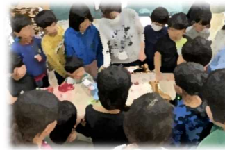
28日(木)3年機織り体験