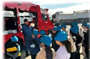
5日(木)3年消防署見学