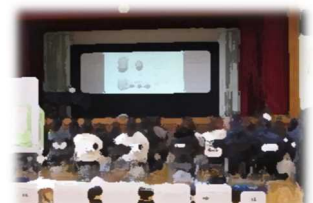
10日(火)新入生保護者説明会