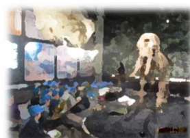
19日(木)3年博物館見学