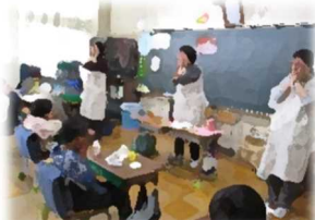
12日(木)4年・レインボー歯科指導