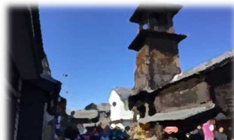
4日(水)レインボー川越探検