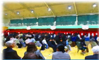
1月30日(火)50周年記念式典