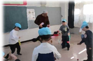
18日(水)1年広瀬公民館昔遊び