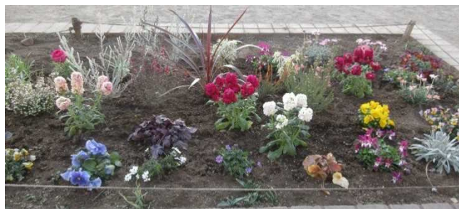
学校ボランティアの皆さんによる寄せ植え

ご家庭でも、お子さんの一年の成長を温かく受け止め、努力を励ましていただければ幸いです。残りわずかとなった今年度を、子供たちが安心して、そして誇りをもって締めくくることができるよう、教職員一同、最後まで力を尽くしてまいります。引き続き、温かいご支援を賜りますようお願い申し上げます。