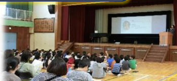
9日(土) 5年宿泊学習説明会