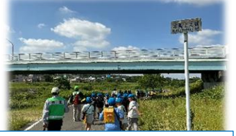
25日(月) 4年入間川探検