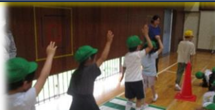
8日(金) 交通安全教室