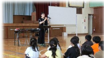
14日(木) 3年リコーダー講習会